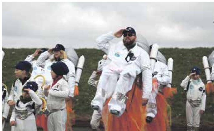
Die „Elbdeichraketen“ räumten den ersten Platz ab.

Faslamsfans erhält. „Mit der Rakete kommst Du nach Stelle – mit dem Auto nicht“. Die Alternative den Nachbarort derzeit zu erreichen, stürmte mit 2377 Punkten den obersten Podestplatz. Völlig losgelöst mit dem Song des Major Tom bo-