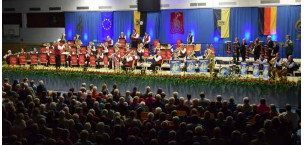
30. Gala vor vollem Haus

Zum Auftakt des Konzertes marschierten die Steller Musikanten in die Halle ein – vornweg war diesmal auch die Musikvereinigung Tostedt dabei, mit denen sie jährlich verschiedene Schützenfeste gemeinsam musikalisch gestalten. Das Opening der