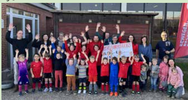
Bei der Scheckübergabe strahlte alle um die Wette.

(in). Fliegenberg. Sie konnten es kaum glauben: Bei der Aktion „Geld für die Guten“ vom Radiosender NDR 2 gewannen die Mitglieder:innen des MTV Fliegenberg 5000 Euro! Innerhalb von fünf Minuten mussten sich mindestens drei registrierte Vereinsmitglieder bei NDR 2 melden. Das Geld wurde von der Deutschen Fernsehlotterie zur Verfügung gestellt. „Unser Stelle“ sagt „Herzlichen Glückwunsch“!