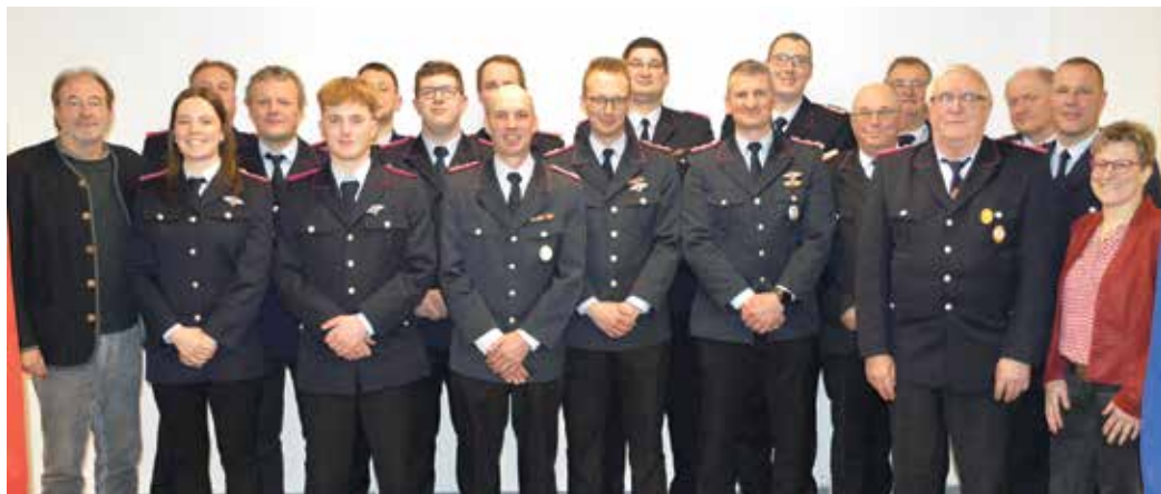
Auf der Jahreshauptversammlung gab es zahlreiche Ehrungen und Beförderungen.

Die Ortfeuerwehr Fliegenberg-Rosenweide absolvierte im vergangenen Jahr 30 Einsätze.