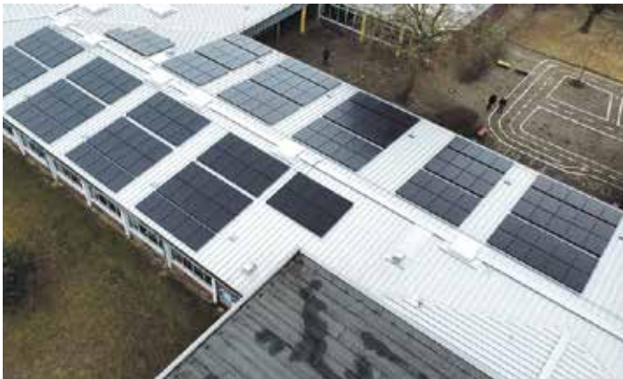
Stadtwerke Winsen (Luhe) GmbH mit der WinBux Energiedienstleistungen GmbH.

(in). Ashausen. Seit Januar bezieht die Grundschule Ashausen sowie die Kita ihren Strom aus Sonnenenergie. Auf dem Dach befindet sich eine neue, große Photovoltaikanlage der Bürger-Solkraftwerke Rosengarten eG.. Das besondere an dieser Anlage: Finanziert wurde sie aus den Einlagen der Genossenschaftsmitglieder.