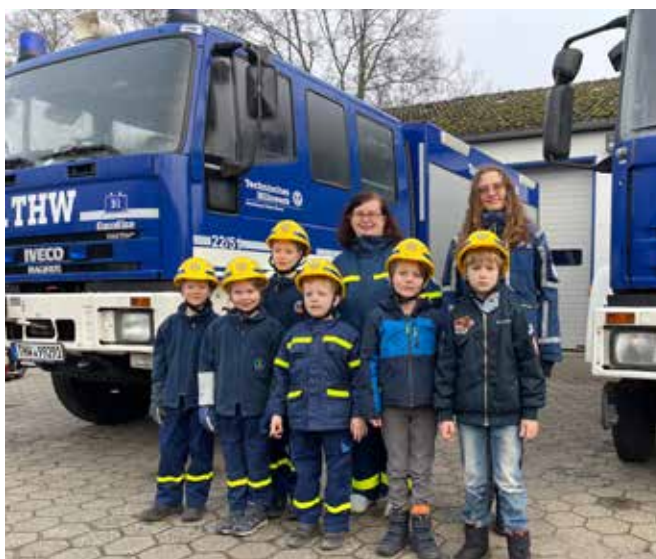
„Spielend helfen lernen“, so lautet das Motto bei den Minis im THW.

(in./nn.). Stelle. Das Motto ist Programm: „Spielend helfen lernen“. Bei der Bundesanstalt Technisches Hilfswerk (THW) wird die Nachwuchsförderung großgeschrieben. Jetzt feierten die „Minis“ in Stelle ihr 10jähriges Jubiläum. Die Mini-Gruppe vermittelt technisch begeisterten Kindern im Alter von sechs bis neun Jahren das THW spielerisch und pädagogisch sinnvoll. In den Gruppenstunden beschäftigen sie sich ihrem Alter angepasst beispielsweise mit Stichen und Bunden, einfacher Holzbearbeitung oder Drachenbau und erlernen so erste Fachkompetenzen. Neben der Schaffung einer sinnvollen Freizeit Beschäftigung für Kinder wie gemeinsam zu spielen, basteln, malen, Handwerken und Ausflüge unternehmen, steht auch die Förderung von Sozialkompetenzen wie Teamwork und sozialem Verhalten im Vordergrund. Mit dem Erreichen des 10. Lebensjahres können die Kinder dann in die THW- Jugendgruppe