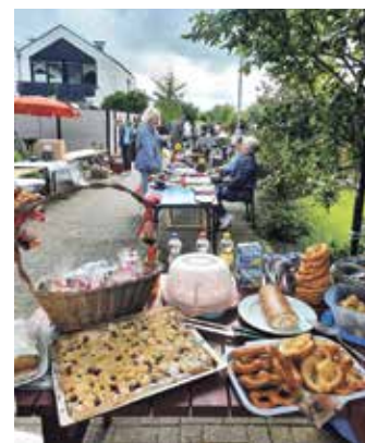
Der beliebte Flohmarkt in der Siedlung „Elbblick“: Hier schlagen die Herzen von Flohmarktfans höher.

Das Organisationsteam freut sich auf zahlreiche Besucher und hofft auf strahlenden Sonnenschein und gute Laune.