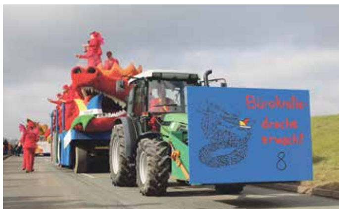
Als bester Festwagen wurde „Bürokratiedrache erwacht“ gewählt.

ten die „Elbdeichraketen beim Umzug auch eine grandiose Tanz-Choreografie den vielen Zuschauern entlang der Narrenmeile.