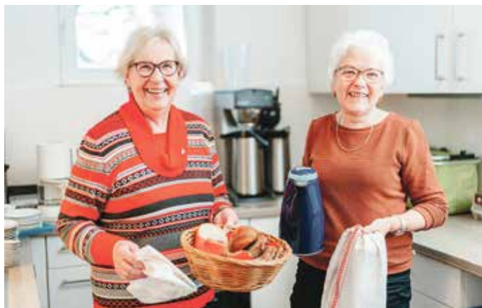
Ehrenamtliche Helferinnen des DRK-Ortsvereins bereiten Leckeres vor.

(in.) Ashausen. Es ist schon eine Tradition geworden: Das beliebte Montagsfrühstück beim DRK-Ortsverein Ashausen/Scharmbeck. Für 2025 sind acht Termine im Gemeindehaus der